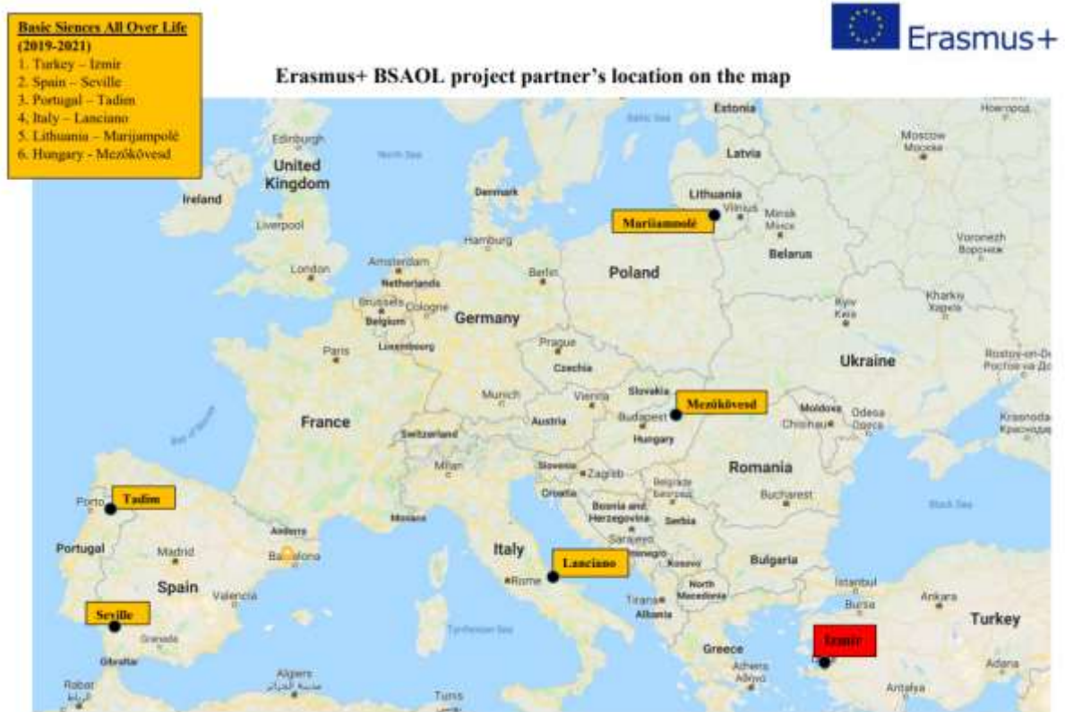
Partnerországok a térképen

A pályázat célja, hogy rávilágítson a természettudományos ismeretek jelentőségére a tanulók mindennapi életében, választ adjon a „Miért tanulunk?” kérdésre, és rendszeresen mérje a pályázatba bevont diákok tudását matematika, biológia, fizika és kémia tárgyakból. Minden tanulói tevékenység angol nyelven zajlik a projektben. A megvalósítás időtartama 2019 novemberétől 2021. májusáig tart.