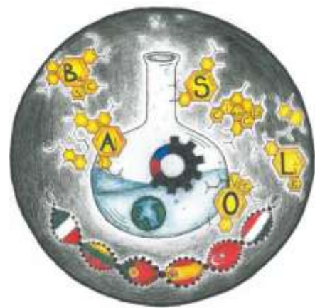
A kiválasztott logók

A továbbképzések és egyéb projekttevékenységek mellett a város nevezetességeit is sorra látogattuk: a székesegyházat, az Alcazart, a Plaza de Espana-t valamint Triana történelmi városnegyedét. Megcsodáltuk Sevilla csempe manufaktúráját és mediterrán hangulatú utcáit.